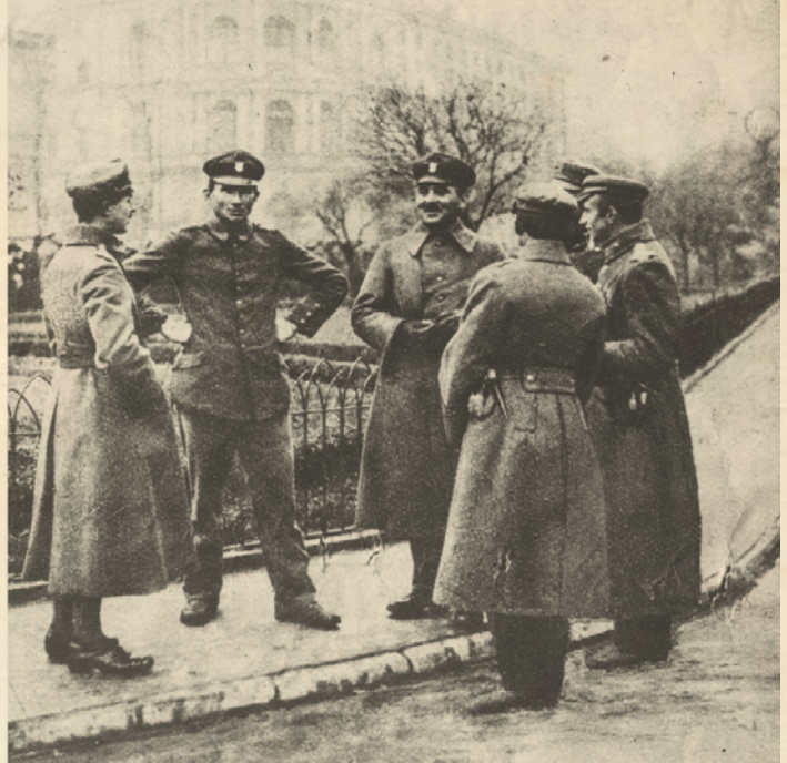
Rozbrojeni żołnierze niemieccy narodowości polskiej / 1918 r.

(Kurjer Warszawski, nr 312, 11 listopada 1918 r.)