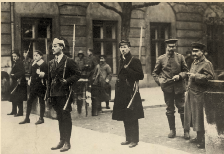
Rozbrajanie Niemców w Warszawie – warta studentów / 1918 r.

Do godz. 2 po południu pogotowie ratunkowe wzywane było 24 razy.