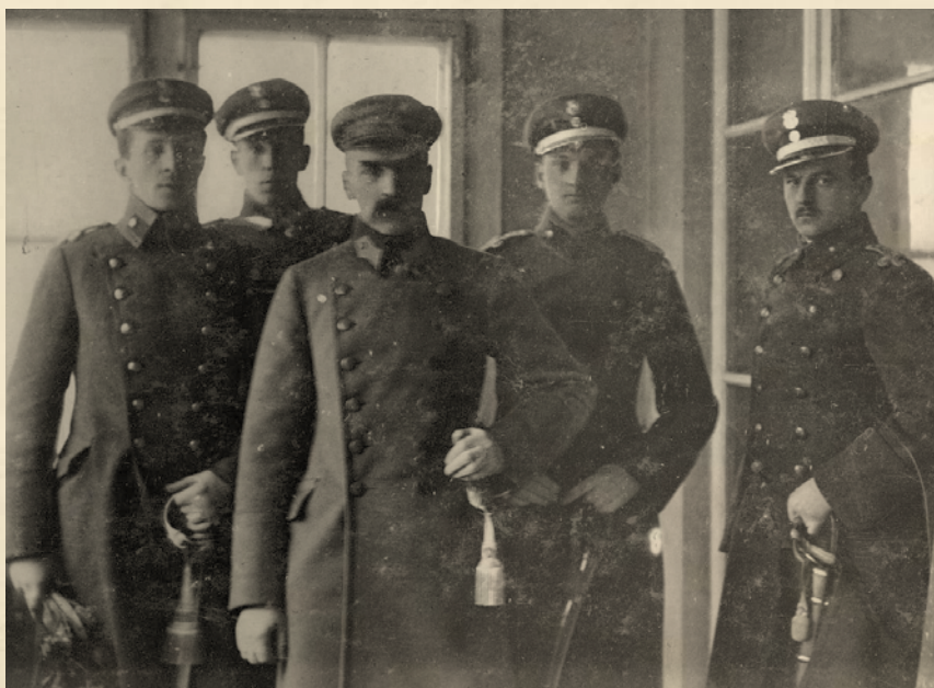
Józef Piłsudski z oficerami / 1918 r.

(Kurjer Warszawski, nr 312, 11 listopada 1918 r.)